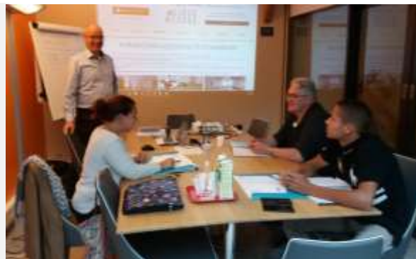
Session de formation à Paris (75)

Consultant-formateur qualifié OPQIBI pour la prise en charge du handicap, responsable et concepteur des formations, gestionnaire du réseau de professionnels HANDI-RENOV.